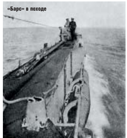
«Барс» в походе

Различные исследователи приводят различные доводы, которые основываются на конструктивных особенностях лодки и хронологии тех событий. Одно можно сказать с уверенностью: на дне Готландской впадины обнаружена российская подлодка типа «Барс». Анализ маршрутов русских подводных лодок во время Первой мировой войны показал, что в этом районе могли погибнуть подводные лодки «Барс», «Львица» или «Гепард». Более конкретный результат могут дать только исследования на месте гибели лодки. На сегодняшний день эти исследования не были никем проведены. Разгадка тайны подлодки, лежащей в глубинах Балтийского моря, так и не найдена. У нашего государства нет возможностей или желания заниматься сложной идентификацией останков. В этом деле даже больше инициативы и участия проявила шведская сторона. С нашей же стороны все закончилось обсуждением в прессе, Интернете и бесплодной официальной перепиской.