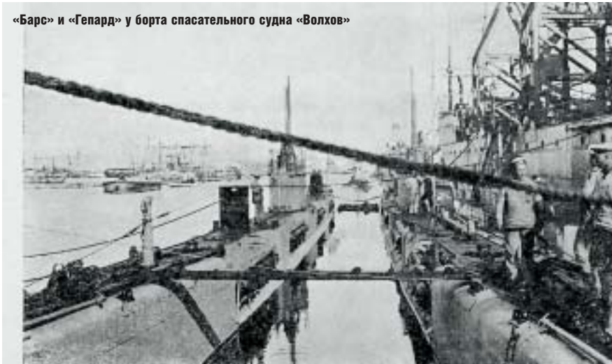
«Барс» и «Гепард» у борта спасательного судна «Волхов»

сательной службы не только средства подводного наблюдения, но и подъема затонувших подводных лодок. И тогда пришлось сосредоточиться на «опознании по приметам», сохранившимся в архивных документах и старинных фотографиях в музеях, частных коллекциях и альманахе «Подводный сборник».