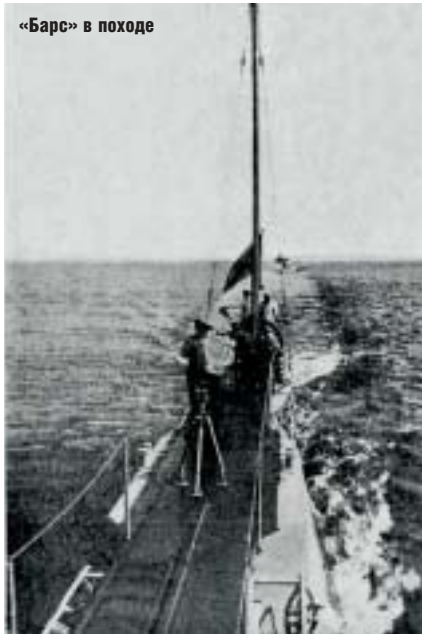
«Барс» в походе

Мы громко призываем всех товарищей, воинов армии и флота, доверить Родину и свободу Вам, состоящим на страже наших народных интересов, призываем не отвлекаться временно от своих прямых воинских задач, ведущих к одному решению: быть нашей Родине свободной, или не быть.