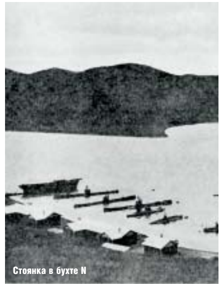
Стоянка в бухте N

3 мая это обращение было передано командующему флотом Балтийского моря вице-адмиралу Максимову, который его одобрил и приказал дивизиону готовиться к совместному походу, из которого «Барс» и не вернулся. Если бы эти честные и искренние моряки знали, в какую катастрофу ввергнут Россию подобные обращения. Жаль, что история не терпит сослогательного наклонения.