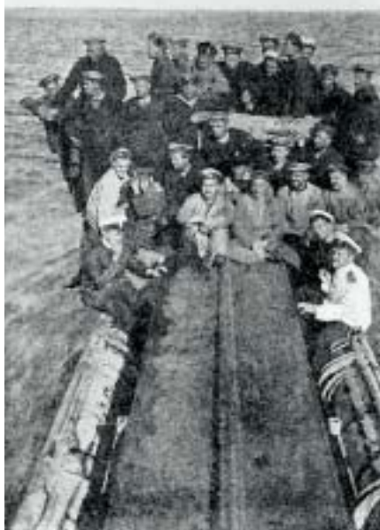
Команда подводной лодки «Барс» на верхней палубе лодки во время похода

А священный долг этот перед нашей драгоценной свободной Родиной настоятельно повелевает нам немедленно активно выступить на арене мировой борьбы за право и свободу народов, в тесном единении с нашими честными союзниками и нашими товарищами, находящимися в их рядах, против Германии, до тех пор, пока германский народ не остановит своих заблуждений, своего Вильгельма и его политику порабощения других народов во славу германского империализма.